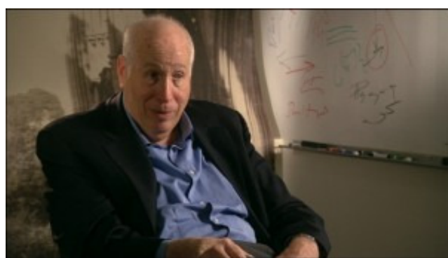
แลร์รี่ ไฮท์ (Larry D. Hite)

“ถ้าเราไม่เดิมพัน เราคงไม่มีโอกาสชนะ แต่หากปล่อยให้เงินหน้าตักหมดลงแล้ว เราก็ไม่อาจเดิมพันได้”